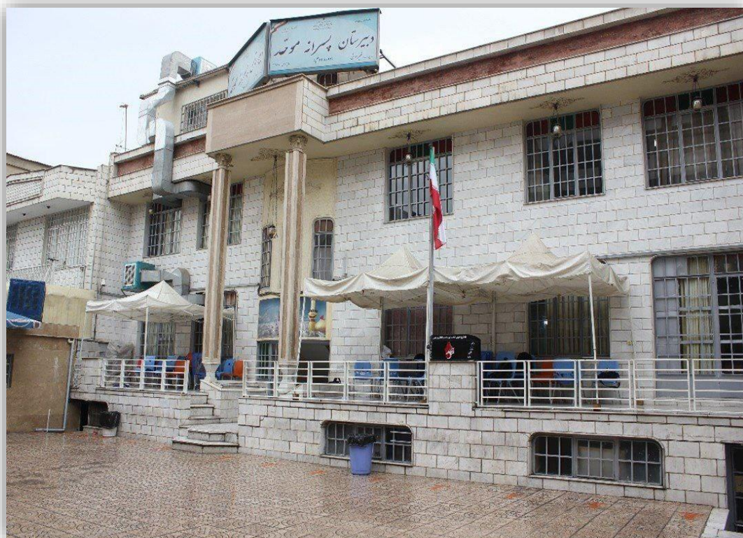
تصویر نمای دبیرستان