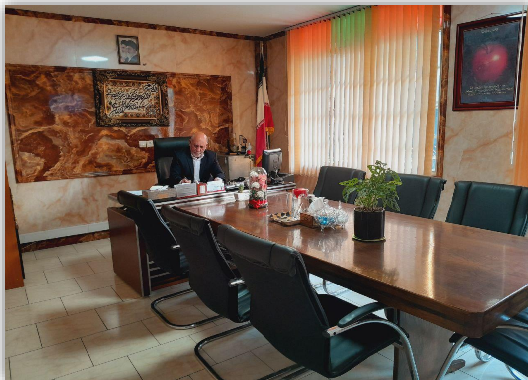
تصویر دفتر مدیریت