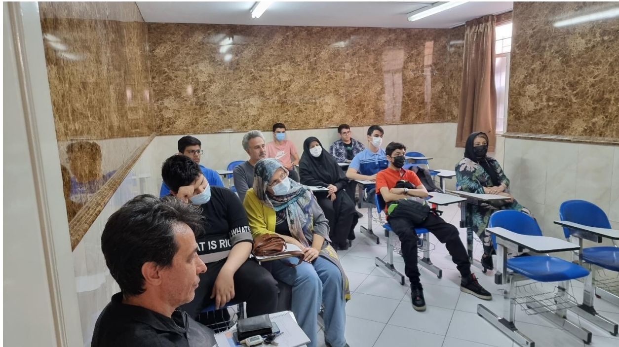
شکل ۲- جلسه هماهنگی با اولیا دانش‌آموزان المپیادی

در راستای هماهنگی هر چه بیشتر بین اولیا و دبیرستان جهت استفاده هر چه بیشتر دانش‌آموزان از کلاس‌های المپیاد جلسه‌ای برگزار گردید.