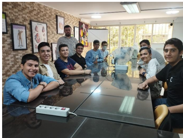
شکل ۱- کارگاه آموزشی رویان