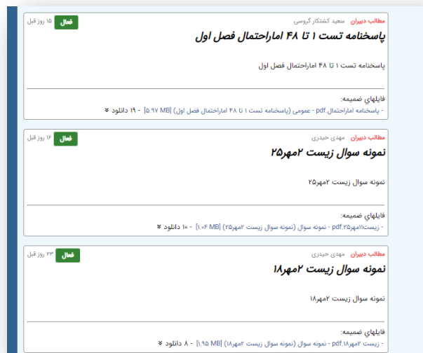
شکل ۴- جزوات و مطالب دبیران در کارسنج

- تهیه گزارش اجمالی تابستانه گزارش عملکرد تابستانه دبیرستان تهیه گردید و در سایت دبیرستان قرار گرفته است.