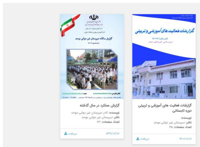
شکل ۵- گزارش تابستانه قرار گرفته در سایت دبیرستان

- تهیه گزارش اجمالی تابستانه گزارش عملکرد تابستانه دبیرستان تهیه گردید و در سایت دبیرستان قرار گرفته است.